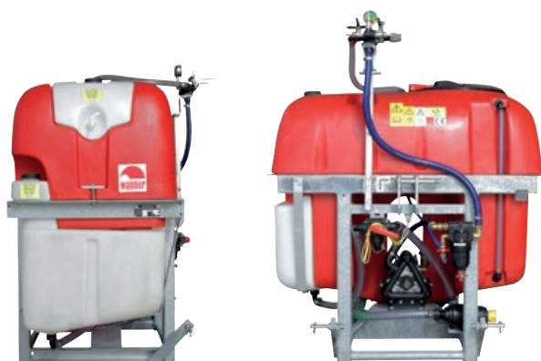
GL400PE, GL500PE, GL600PE, GL800PE, GL1000PE, GL1200PE, GL1500PE PE-Tank mit 400 – 1.500 Liter Nennvolumen